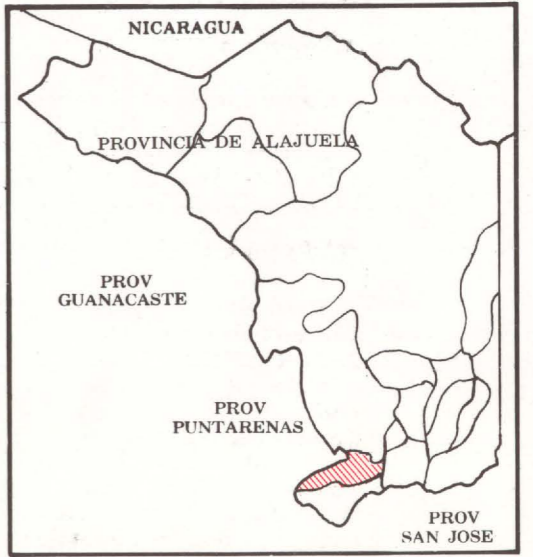
DIAGRAMA DE LOCALIZACION

PREPARADO POR EL INSTITUTO DE FOMENTO Y ASESORIA MUNICIPAL EN COLABORACION CON EL INSTITUTO GEOGRAFICO NACIONAL DE COSTA RICA.