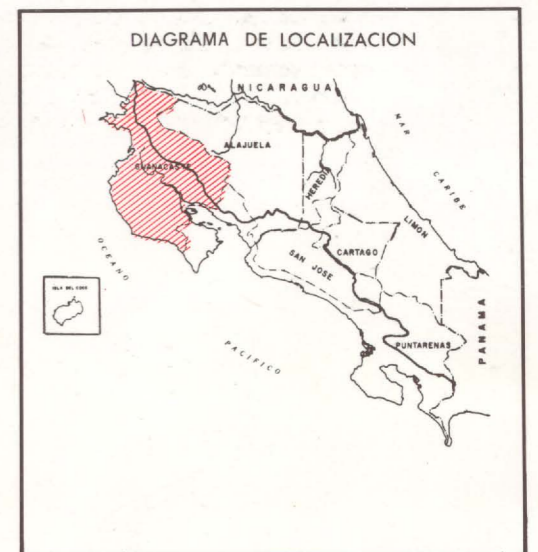
DIAGRAMA DE LOCALIZACION

PREPARADO POR EL INSTITUTO DE FOMENTO Y ASESORIA MUNICIPAL EN COLABORACION CON EL INSTITUTO GEOGRAFICO NACIONAL DE COSTA RICA.