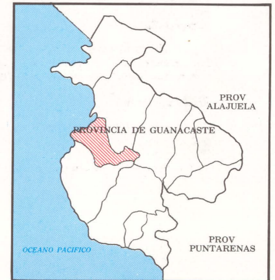
DIAGRAMA DE LOCALIZACION

PREPARADO POR EL INSTITUTO DE FOMENTO Y ASESORIA MUNICIPAL EN COLABORACION CON EL INSTITUTO GEOGRAFICO NACIONAL DE COSTA RICA.