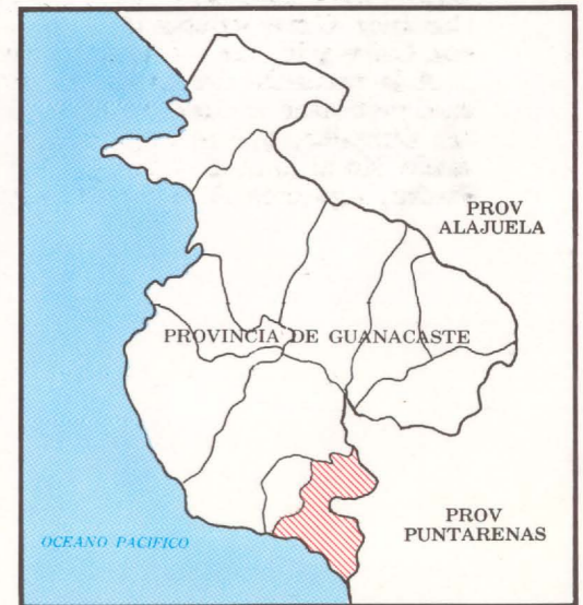
DIAGRAMA DE LOCALIZACION

PREPARADO POR EL INSTITUTO DE FOMENTO Y ASESORIA MUNICIPAL EN COLABORACION CON EL INSTITUTO GEOGRAFICO NACIONAL DE COSTA RICA.