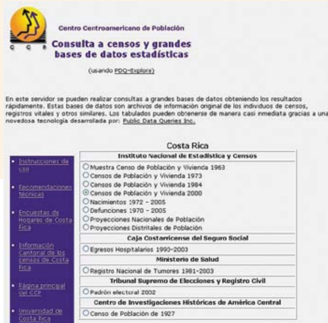
Portal de entrada al servidor en que el usuario escoge la base de datos que desea tabular.

cuidados del adulto mayor, entre otros-. “Hay cosas fascinantes”, asegura Rosero. “Se debe restar la visión apocalíptica que algunos han querido darle al tema. Si el país no se queda de brazos cruzados, no tiene por qué ser así. Incluso hay factores positivos interesantes”.